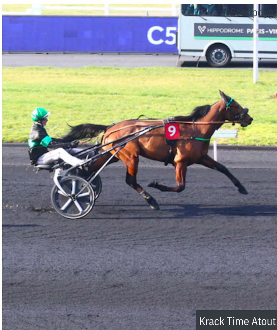
Krack Time Atout