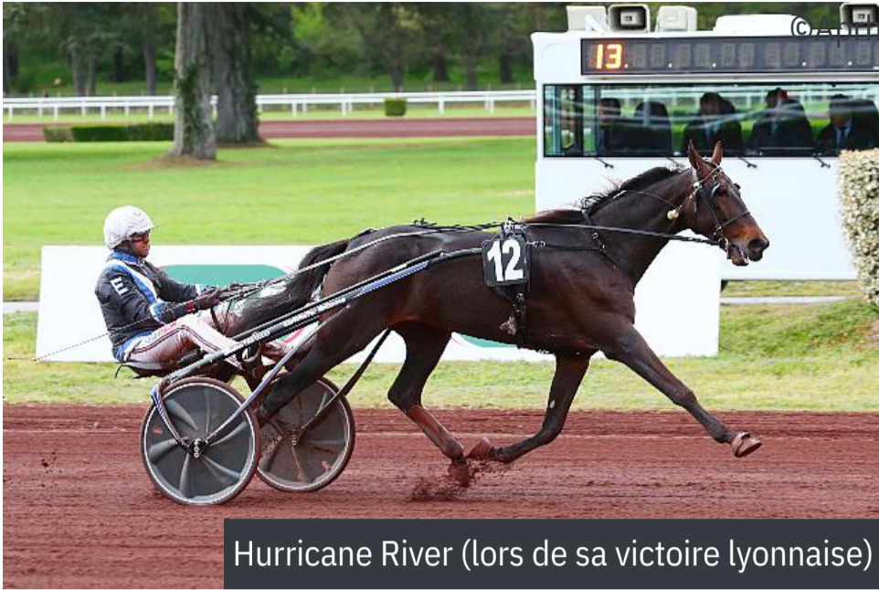
Hurricane River (lors de sa victoire lyonnaise)