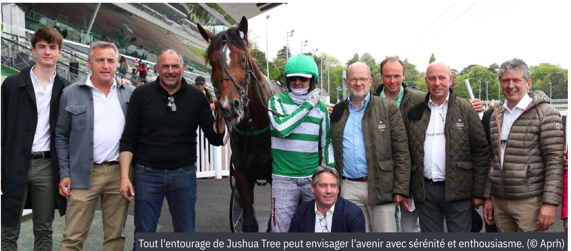
Tout l'entourage de Jushua Tree peut envisager l'avenir avec sérénité et enthousiasme.