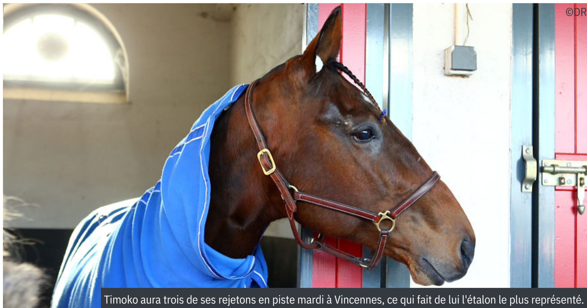
Timoko aura trois de ses rejetons en piste mardi à Vincennes, ce qui fait de lui l'étalon le plus représenté.