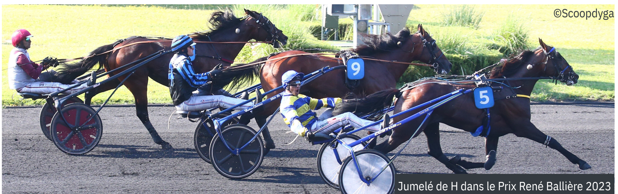
Jumelé de H dans le Prix René Ballière 2023