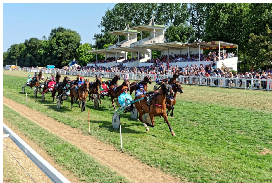
Dernière réunion de l'année sur l'hippodrome de Chinon-Richelieu ce 15 août

18 réunions et 117 courses de trot, c'est le programme offert lors de ce mardi 15 août.