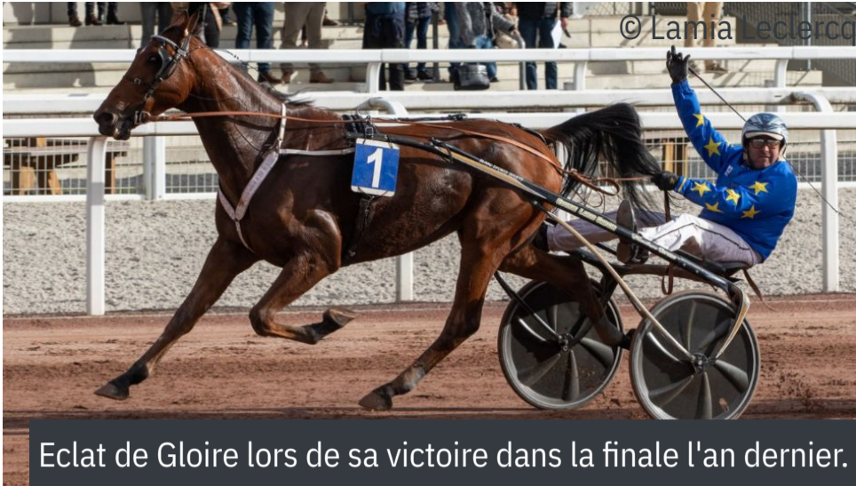
Éclat de Gloire lors de sa victoire dans la finale l'an dernier.