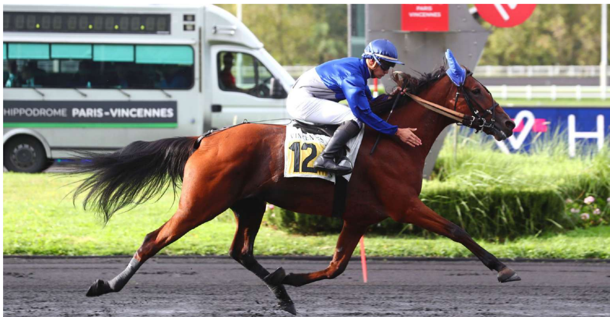
Good Girl Marceaux aura fait aussi bien qu'Idao de Tillard cet été statistiquement : 3 courses 3 victoires

Granit Meslois (Shadow d'Odysée x And Arifant).