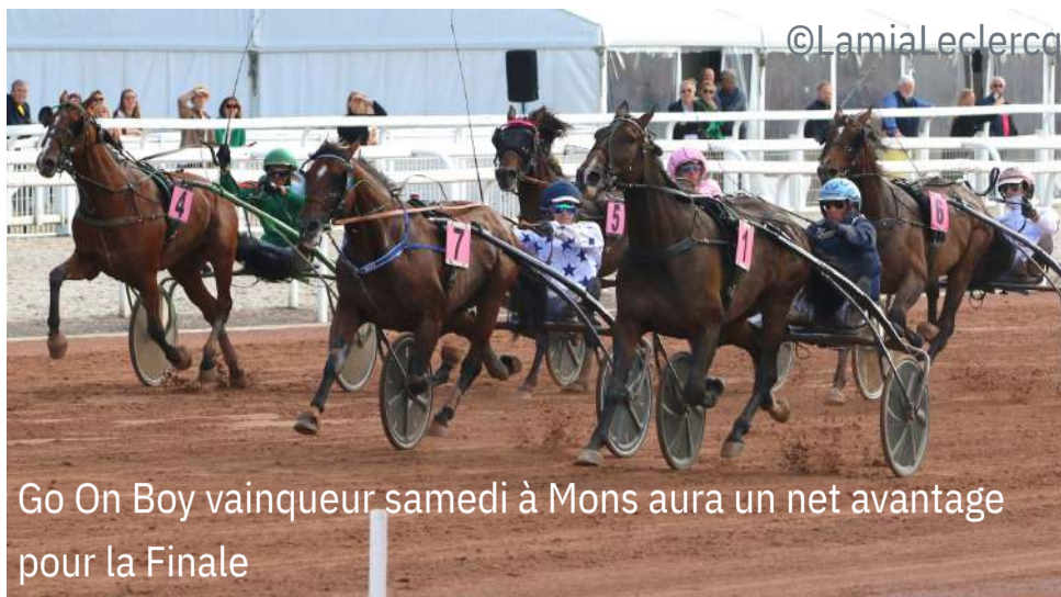
Go On Boy vainqueur samedi à Mons aura un net avantage pour la Finale