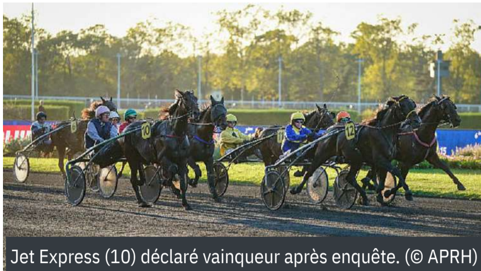
Jet Express (10) déclaré vainqueur après enquête.