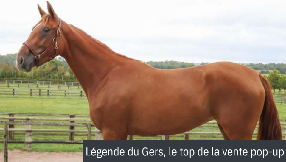
Légende du Gers, le top de la vente pop-up