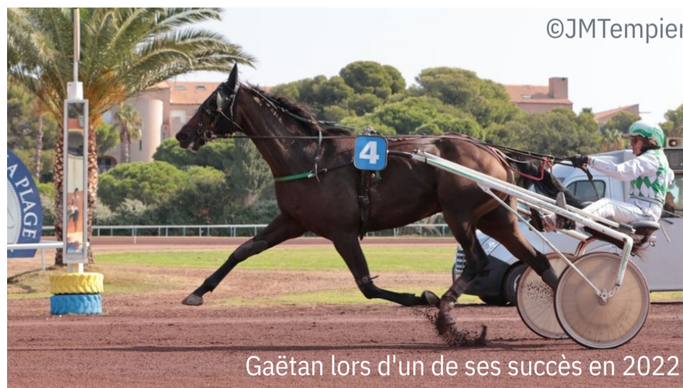
Gaëtan lors d'un de ses succès en 2022