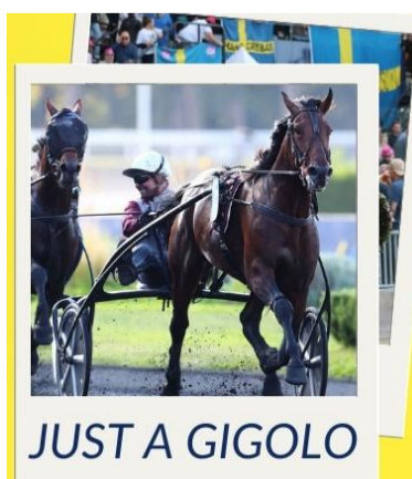
JUST A GIGOLO