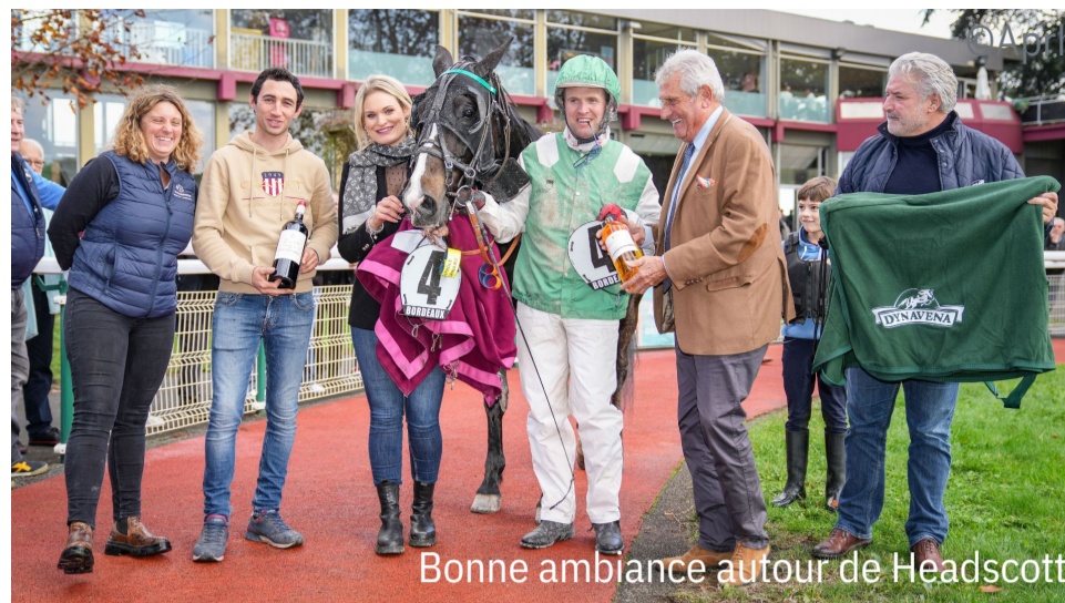
Bonne ambiance autour de Headscott

4 e : Koccinelle Bey - 5 e : Kanak du Bocage - 6 e : Keona Delalande - 7 e : Katona