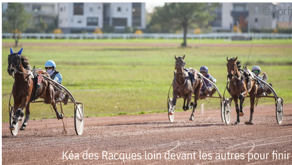
Kéa des Racques loin devant les autres pour finir