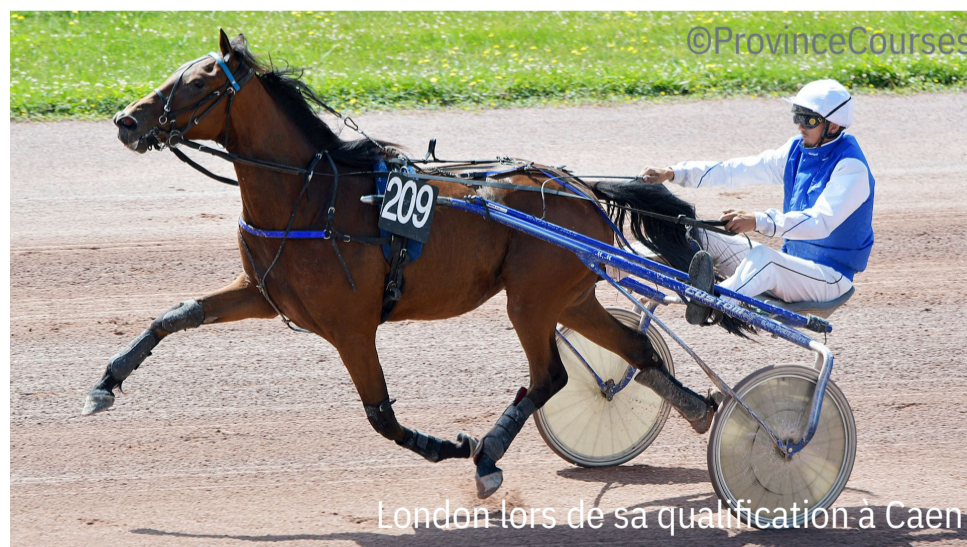
London lors de sa qualification à Caen