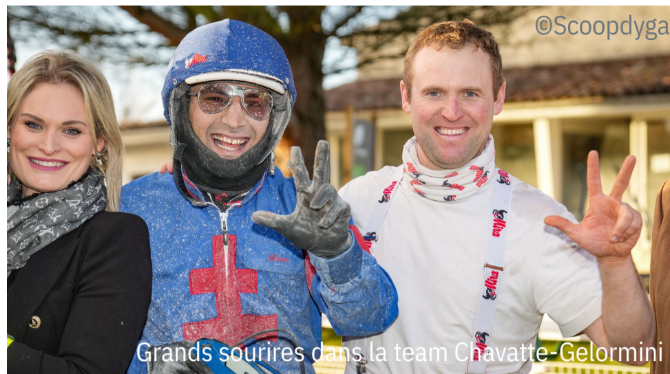
Grands sourires dans la team Chavatte-Gelormini

4 e : Flopy Rush - 5 e : Gladys Tartifume - 6 e : Editeur La Ravelle - 7 e : Ermes de Corday