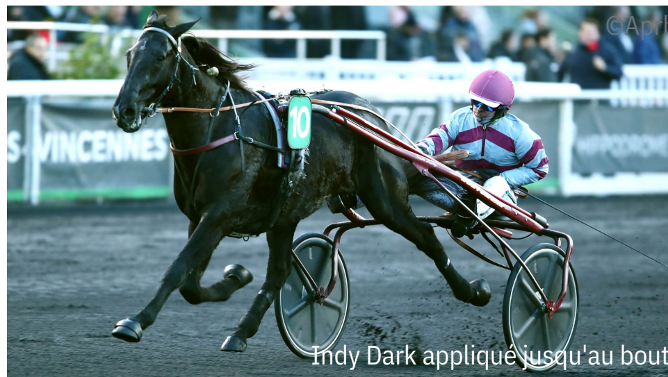
Indy Dark appliqué jusqu'au bout