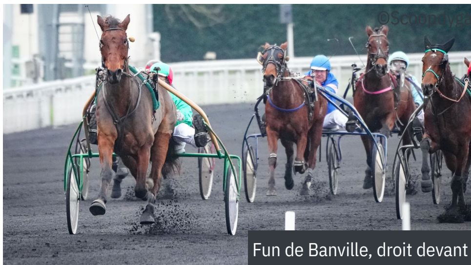
Fun de Banville, droit devant