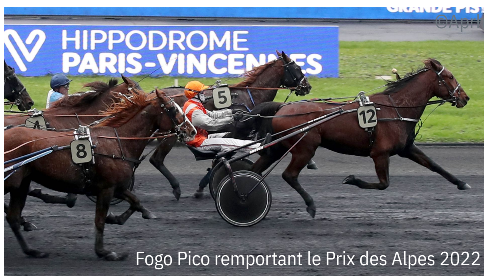
Fogo Pico remportant le Prix des Alpes 2022