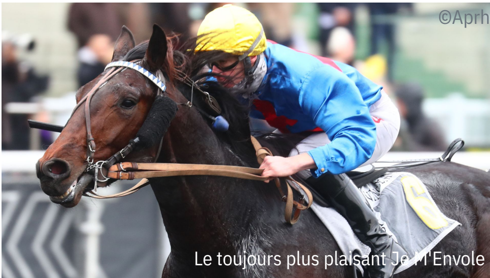
Le toujours plus plaisant Je M'Envole