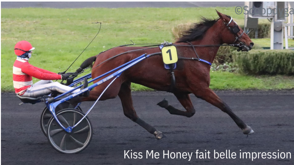
Kiss Me Honey fait belle impression