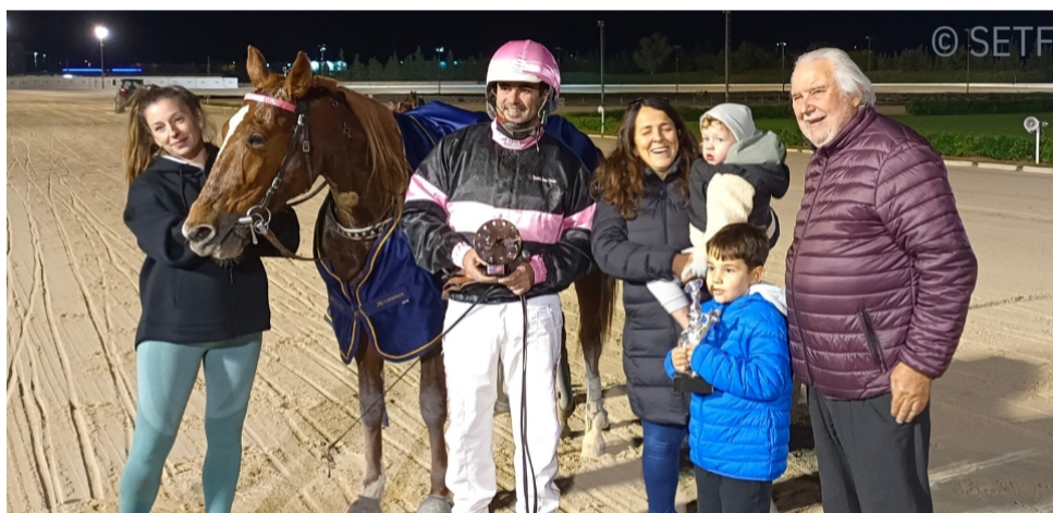
Gagneuse d'Or, lauréate d'une des deux finales de Son Pardo