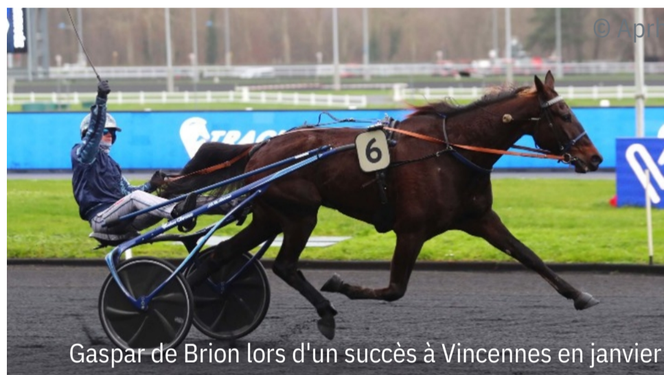
Gaspar de Brion lors d'un succès à Vincennes en janvier

Apparenté à Face Time Bourbon , Le Poète Bourbon ( Love You ) a crevé l'écran lors de ses débuts victorieux le 9 novembre dernier sur l'hippodrome de Laval. Qualifié en 1'19"9 le 16 juin à Cordemais, ce neveu des championnes Mara Bourbon (And Arifant) et Qualita Bourbon ( Love You ) va découvrir la grande piste de Vincennes ce jeudi dans le Prix des Bégonias. L'épreuve a été remportée par Krack Time Atout ( Face Time Bourbon ) l'an dernier. Autre récent vainqueur, Le Voyou d'Almo (Thorens Védaquais) tentera de lui barrer la route du succès.