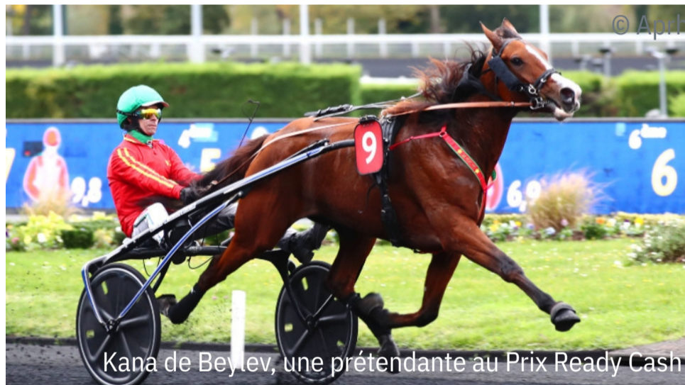
Kana de Beylev, une prétendante au Prix Ready Cash

L'affiche qui se dessine dans le Prix Ready Cash - Sulky World Cup 4 Ans Q3 (Gr.1) promet beaucoup. Le Groupe 1 au programme dominical de dimanche compte 21 restants engagés ce mercredi. Les leaders français figurent bien sur la liste, à savoir les mâles Koctel du Dain ( Boccador de Simm ), Krack Time Atout ( Face Time Bourbon ), King Opéra ( Ready Cash ), Kristal Josselyn ( Bold Eagle ) et la pouliche Kana de Beylev ( Express Jet ). Tous ont leur monte déclarée. L'épreuve internationale vaudra aussi pour l'entrée de scène sur la cendrée parisienne du suédois Fiftyfour ( Fourth Dimension ). Deuxième du Svenskt Trav-Kriterium (Gr.1), le 14 octobre à Solvalla, ce pensionnaire de Tomas Malmqvist reste sur un succès à Jägersro. Björn Goop sera son partenaire dimanche. Parmi les candidats italiens toujours déclarés, notons Edy Girifalco Gio ( Victor Gio ), deuxième dernièrement du Grand Prix Paolo et Orsi Mangelli (Gr.1) à Turin, et East Asia ( Ready Cash ), au palmarès riche de deux Groupes 1.