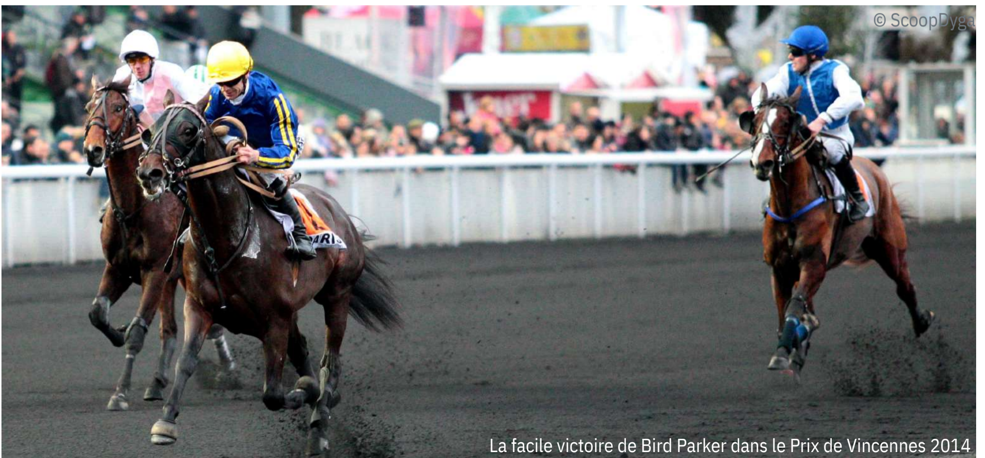
La facile victoire de Bird Parker dans le Prix de Vincennes 2014