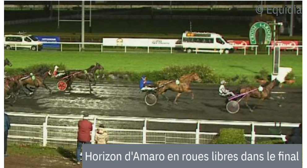
Horizon d'Amaro en roues libres dans le final

4 e : Impala Park - 5 e : Honneur d'Isques - 6 e : Ideal du Biston - 7 e : Henao de Victhi