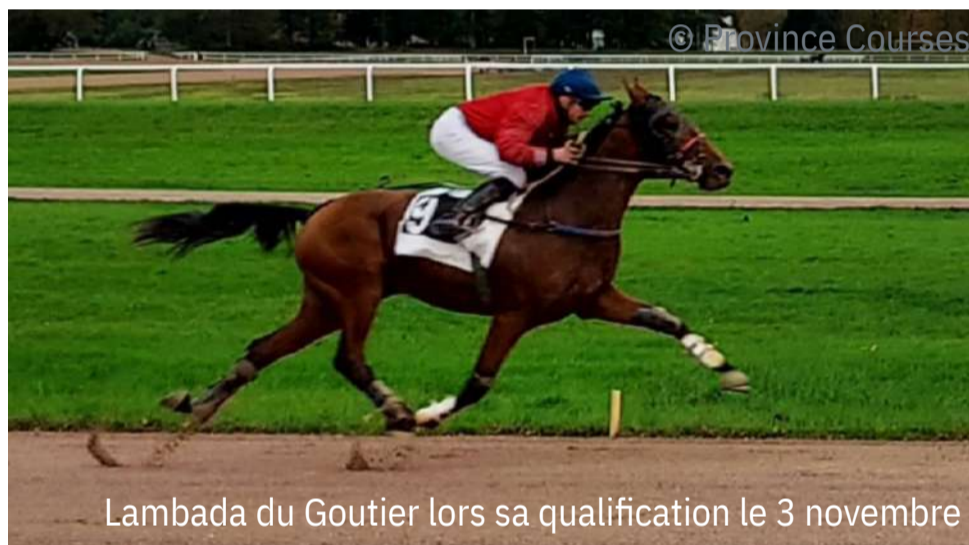
Lambada du Goutier lors sa qualification le 3 novembre