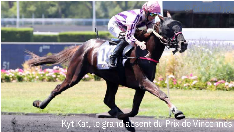
Kyt Kat, le grand absent du Prix de Vincennes