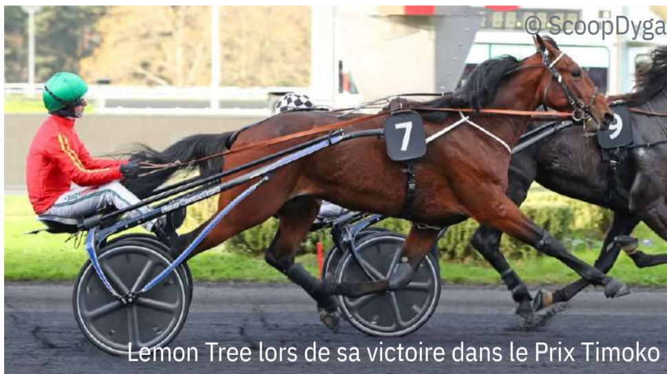
Lemon Tree lors de sa victoire dans le Prix Timoko