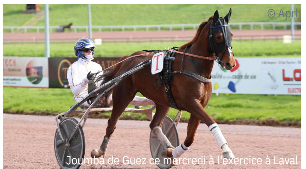
Joumba de Guez ce mercredi à l'exercice à Laval