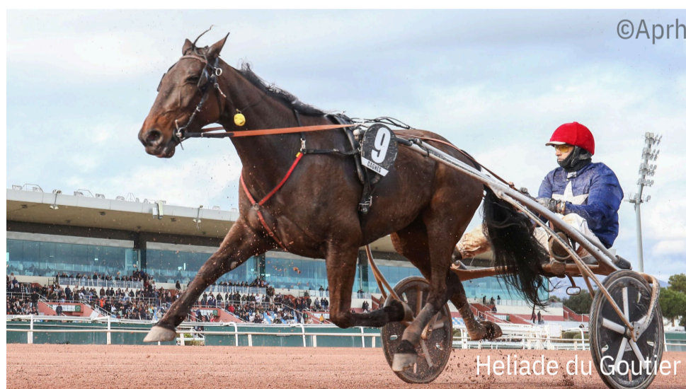
Héliade du Goutier

La Française Heliade du Goutier (Prodigious) fait partie des treize chevaux engagés pour le Premio Costa Azzurra (Gr.1) du 7 avril prochain à Turin. On retrouve également dans cette liste le champion aux 21 Groupes 1 et tenant du titre Vivid Wise As (Yankee Glide), Always Ek (Filipp Roc), vainqueur cet hiver à Vincennes ou encore Bleff Dipa (Mister J.P.). Les partants seront connus lundi prochain, 1er avril.