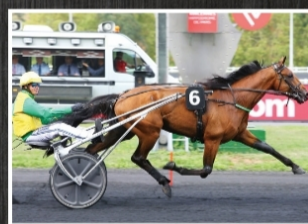
Face Time Bourbon