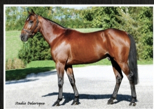
Ideal du Pommeau