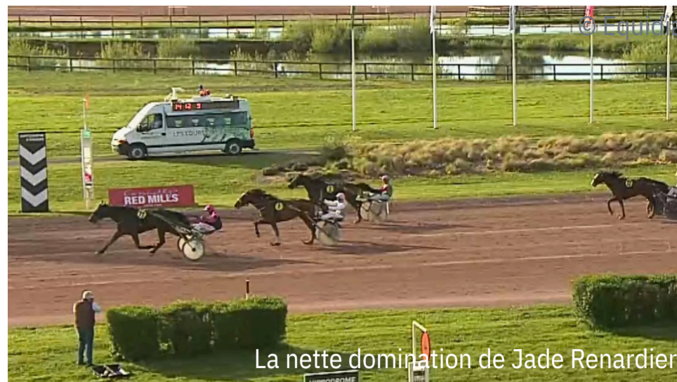
La nette domination de Jade Renardier

4 e : Jerenal d'Hameline - 5 e : Imhotep Burois - 6 e : Javelot de Houelle - 7 e : Judy Matidy