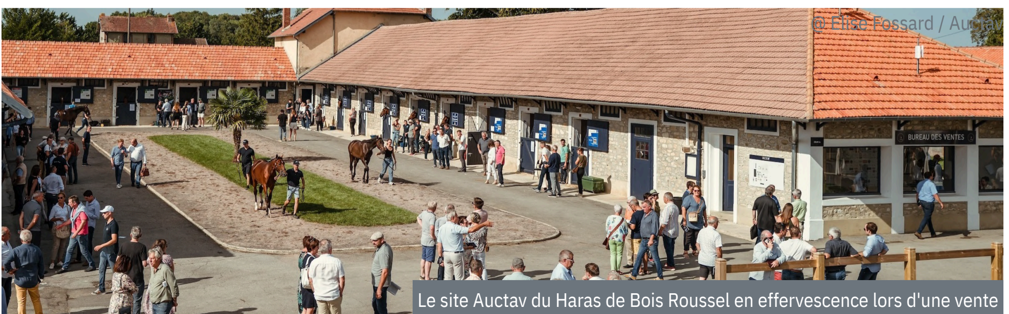
Le site Auctav du Haras de Bois Roussel en effervescence lors d'une vente