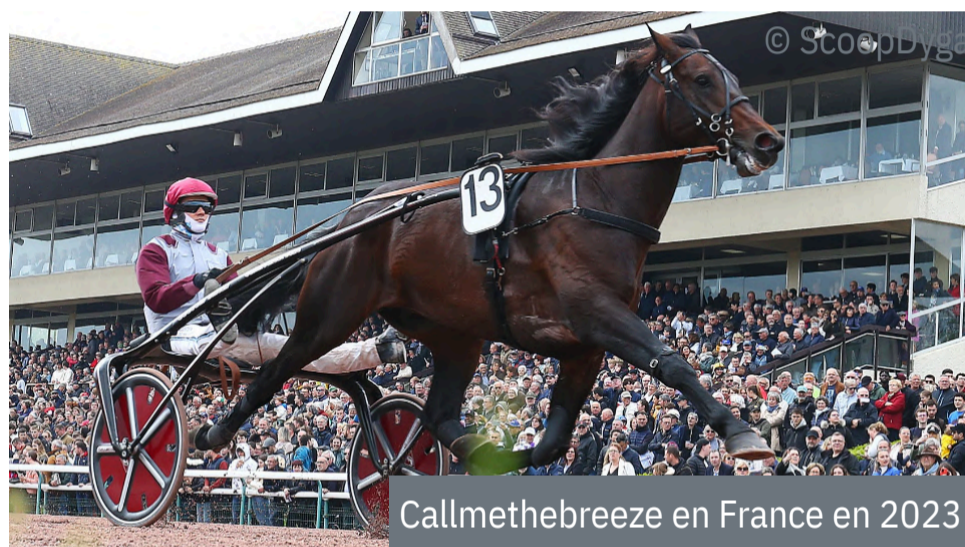
Callmethebreze en France en 2023

C 'est l'épreuve la plus richement dotée de Nouvelle-Zélande (avec 600.000 $NZ) et elle se disputera ce vendredi. Le TAB Trot est une "slot race", c'est-à-dire une course dans laquelle les propriétaires achètent la place de leur représentant au départ. L'épreuve permettra de revoir à l'oeuvre les deux meilleurs actuels d'Océanie, JUST BELIEVE (Love You) et CALLMETHEBREEZE (Trixtion). Le premier mène 2 à 1 aux termes de leurs trois premières rencontres. Ils ont respectivement reçu les places 3 et 4 derrière l'autostart (sur un parcours de 2.200m).