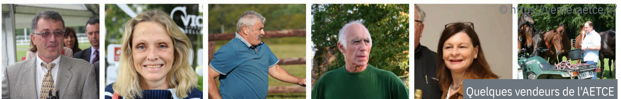
Quelques vendeurs de l'AETCE