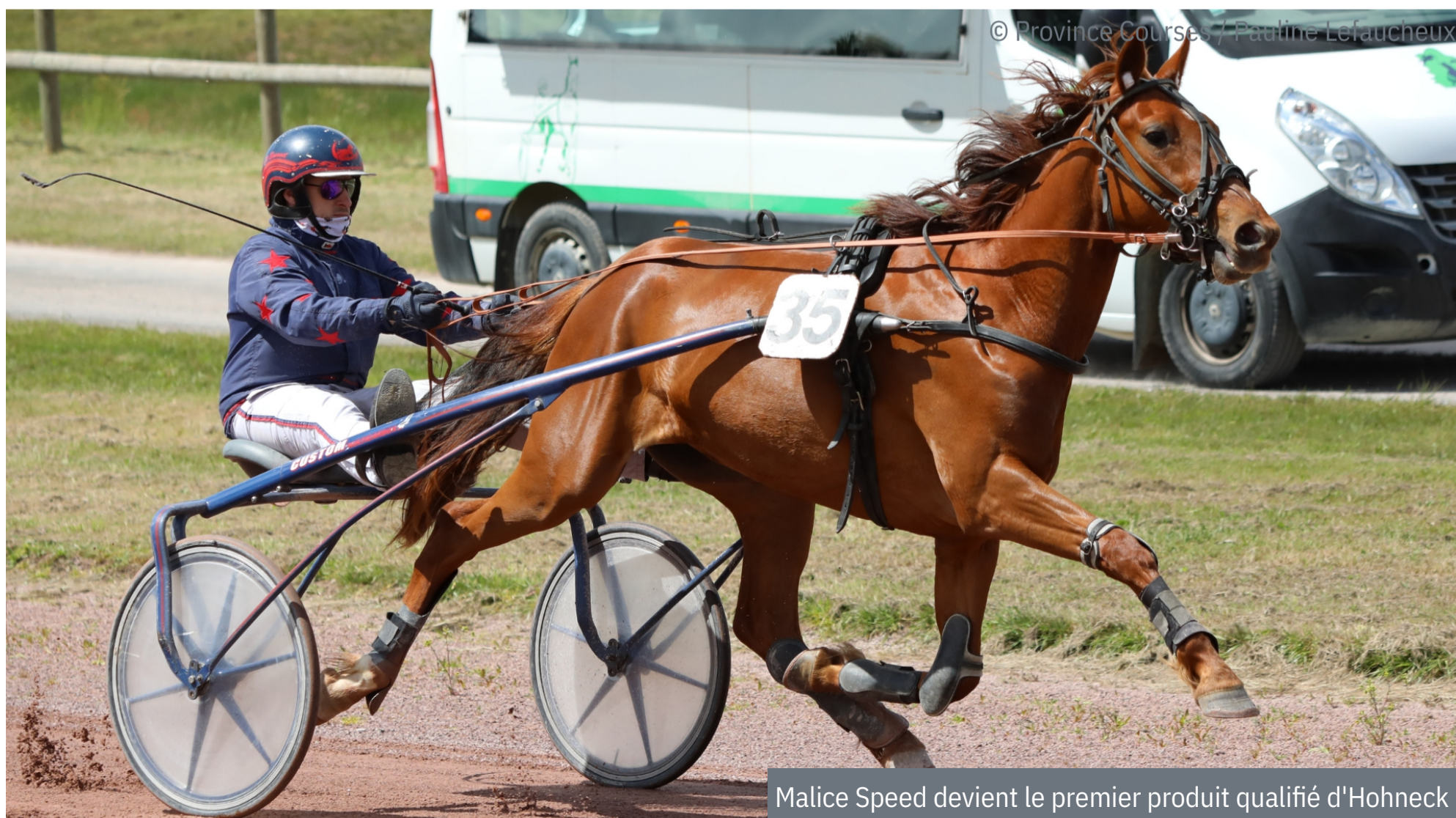
Malice Speed devient le premier produit qualifié d'Hohneck