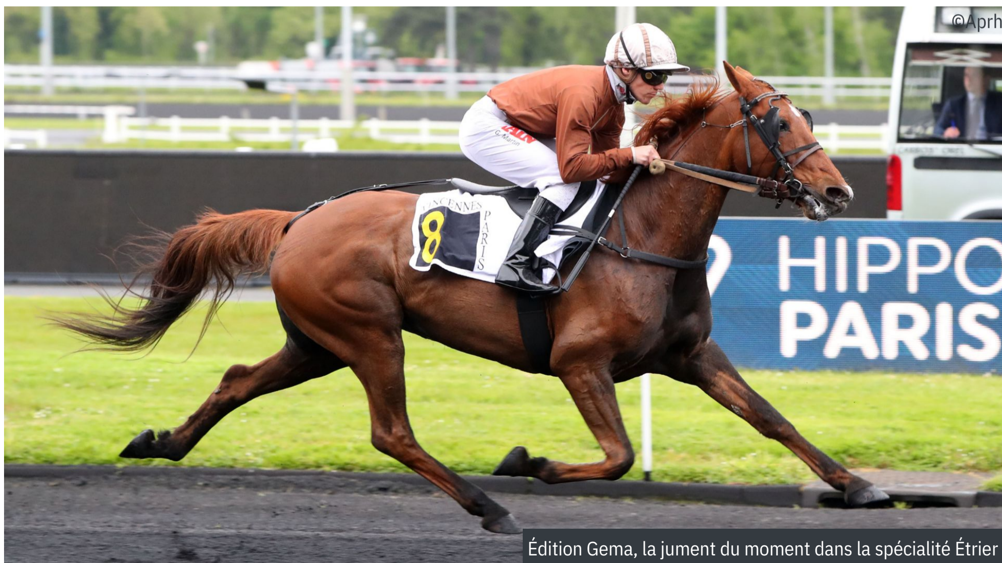
Édition Gema, la jument du moment dans la spécialité Étrier