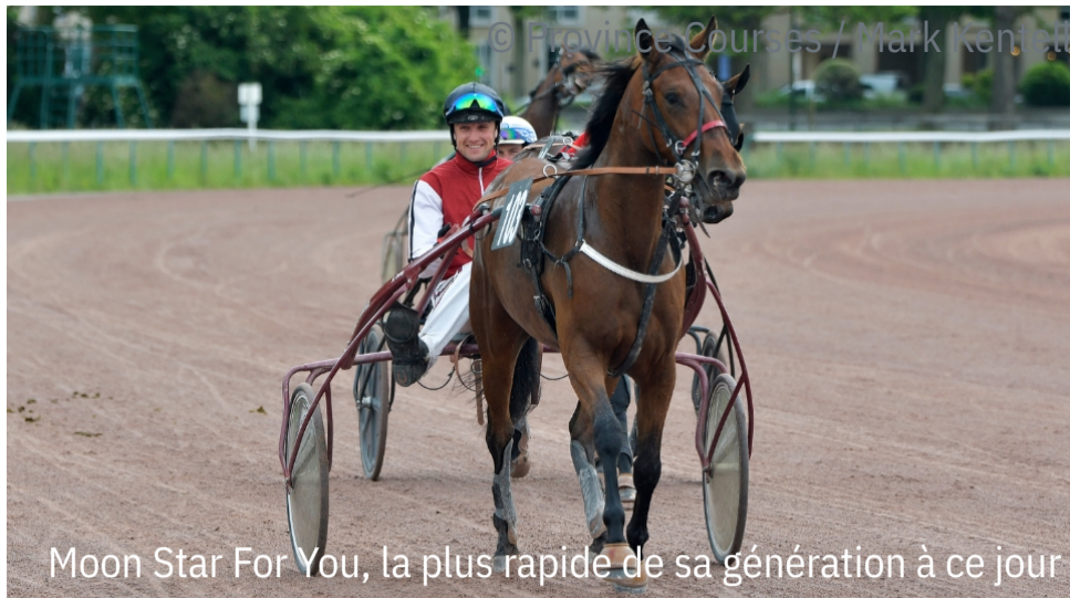
Moon Star For You, la plus rapide de sa génération à ce jour