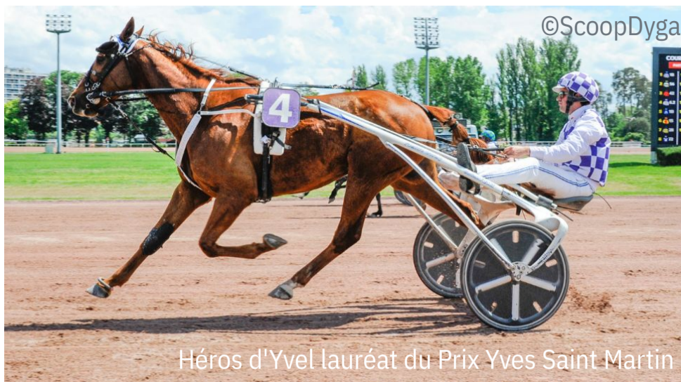
Héros d'Yvel lauréat du Prix Yves Saint Martin