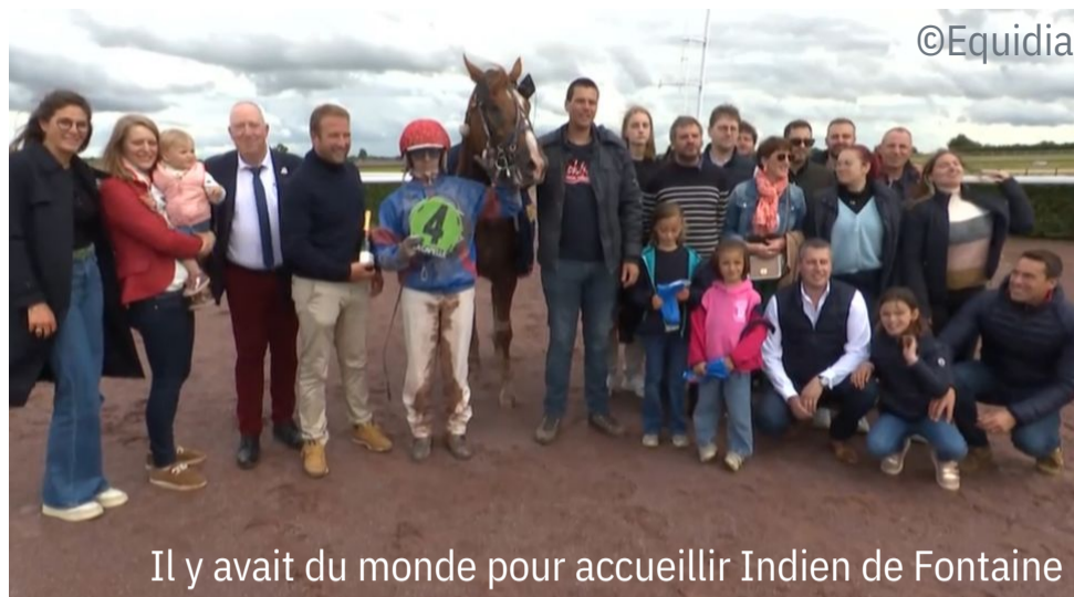
Il y avait du monde pour accueillir Indien de Fontaine