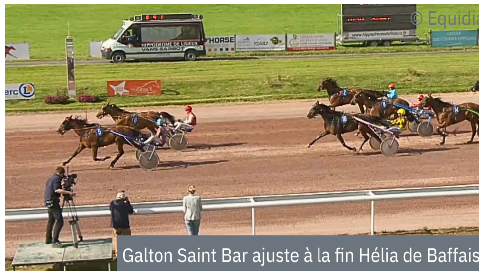
Galton Saint Bar ajuste à la fin Hélia de Baffais

4 e : L'Histoire Secrete - 5 e : Laska Angele - 6 e : Liberee des Forges - 7 e : Lovely Jenilou