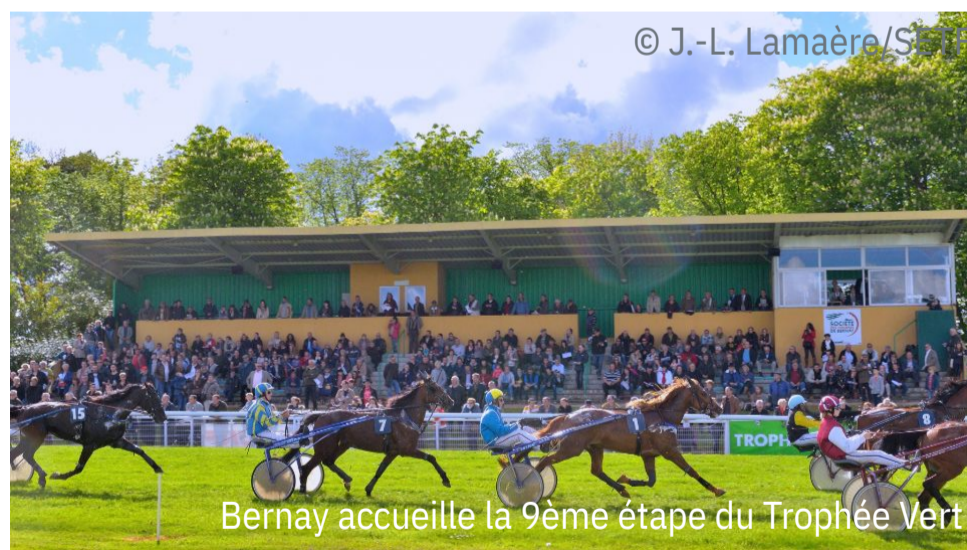
Bernay accueille la 9 ème étape du Trophée Vert