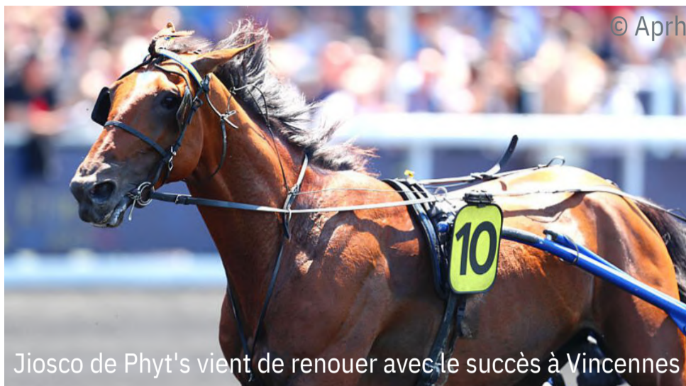
Jiosco de Phyt's vient de renouer avec le succès à Vincennes