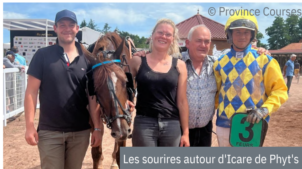
Les sourires autour d'Icare de Phyt's

4 e : Jingle des Brouets - 5 e : Jiscard - 6 e : Jurancon - 7 e : Isola Santa