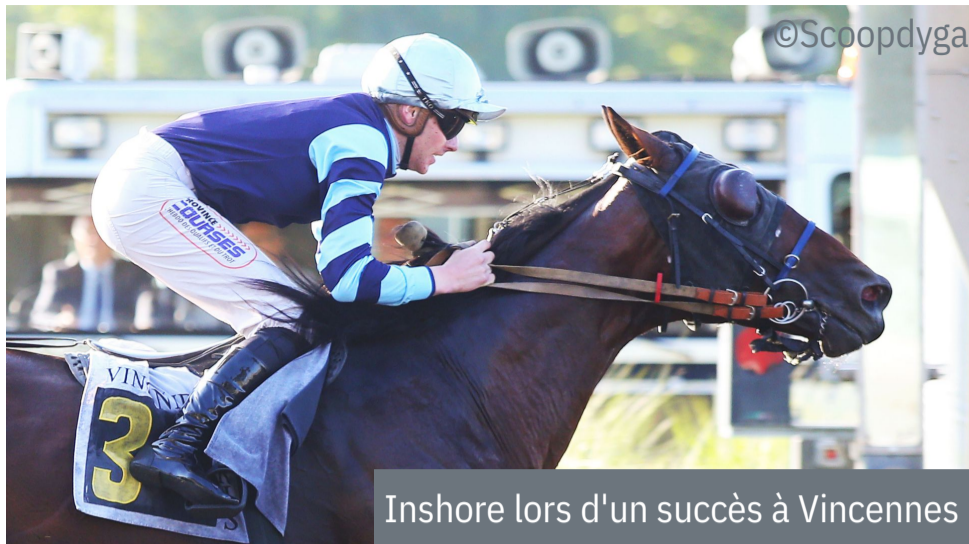
Inshore lors d'un succès à Vincennes