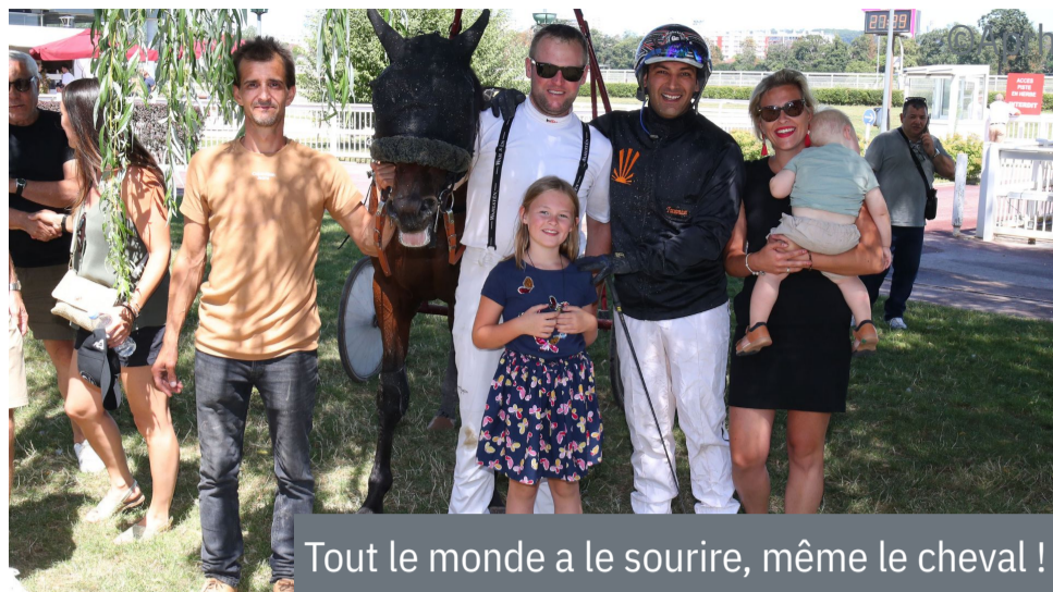
Tout le monde a le sourire, même le cheval !