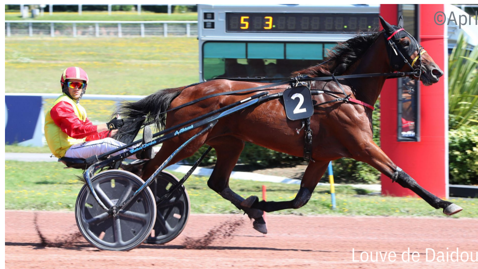
Louve de Daidou