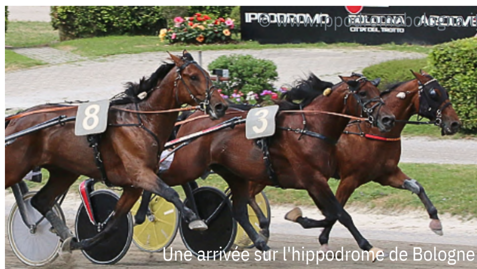
Une arrivée sur l'hippodrome de Bologne

Dimanche dernier, sur l'hippodrome de Bologne, le 4 ans français Knockonwood (Ready Cash) s'est vu refuser en début d'après-midi par les autorités locales de prendre le départ du Gran Premio Continentale (Gr.1) après être arrivé sur place aux alentours de midi (selon son entourage), soit un peu plus tard que prévu en raison d'une crevaison sur la route du camion qui le conduisait de Modène, où il avait fait étape, à Bologne. Cette décision a suscité l'indignation de son entraîneur, Romain Larue, sous couvert, semble-t-il, d'une incompréhension quant à l'exacte signification du terme "convegno" dans le règlement des autorités hippiques italiennes. Dans le cas présent, la législation impose que "la durée de la période d'isolement est de trois heures avant le début de l'heure de départ prévue de la première course de la journée dans le cas des grands prix de trot". Dimanche, le départ de la première course était fixé à 14h25 à Bologne. Toujours est-il que ce contre-temps fâcheux aurait probablement pu être évité par une meilleure communication.