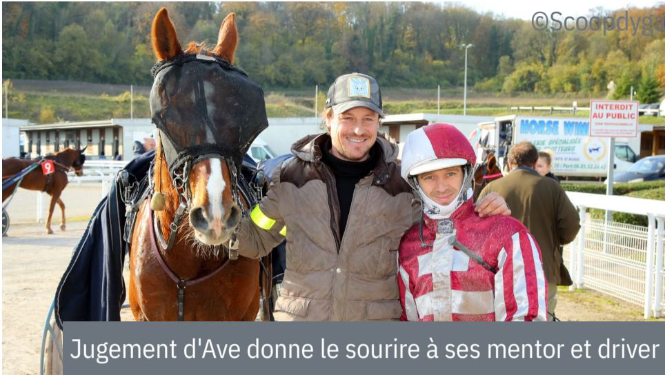
Jgement d'Ave donne le sourire à ses mentor et driver