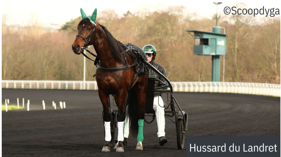
Hussard du Landret