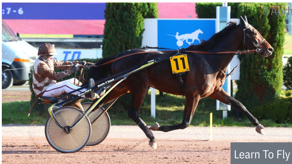
Learn To Fly