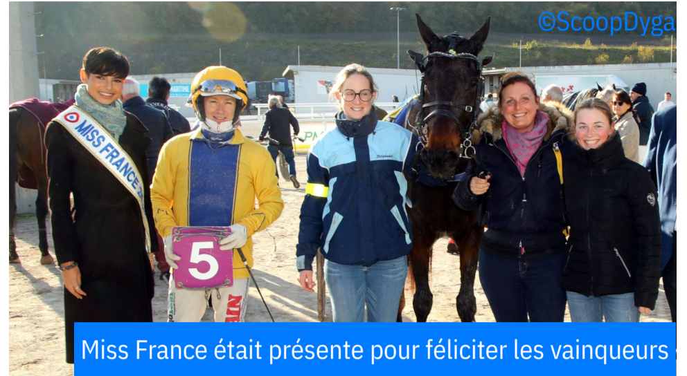
Miss France était présente pour féliciter les vainqueurs

4 e : Joker d'Occagnes - 5 e : Jupiter Madrik - 6 e : Jardin d'Erable - 7 e : Jalimede