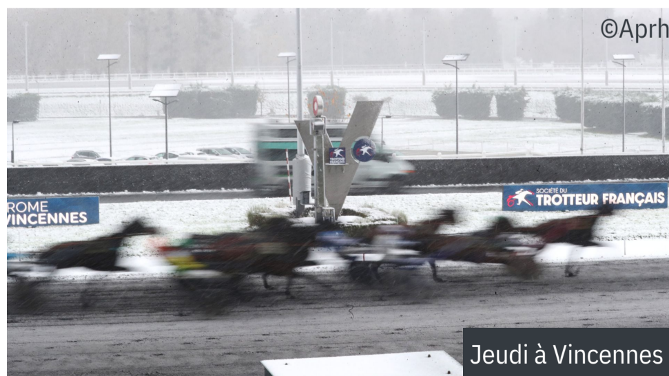
Jeudi à Vincennes