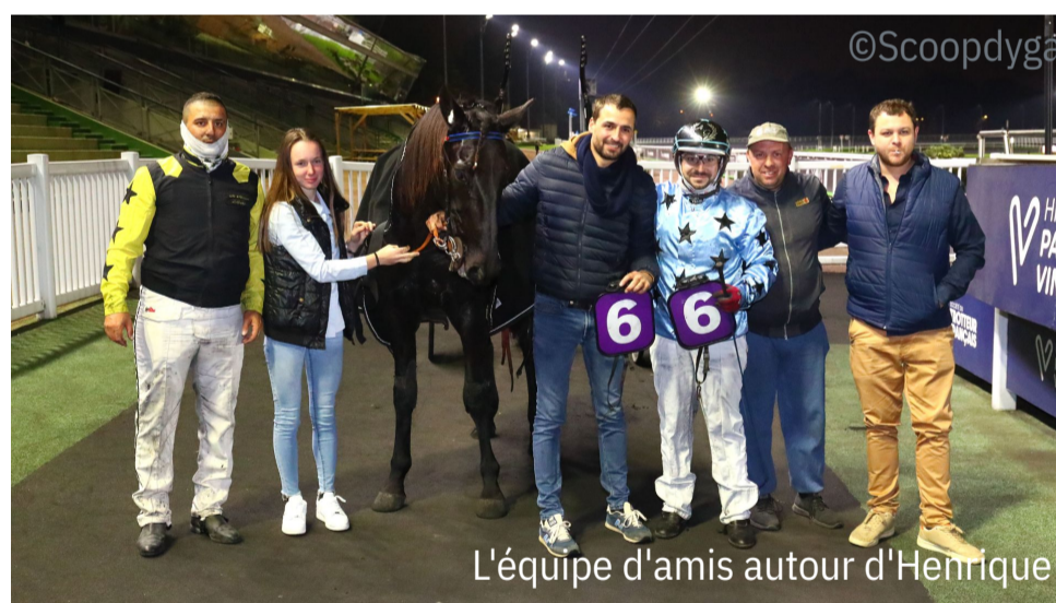
L'équipe d'amis autour d'Henrique