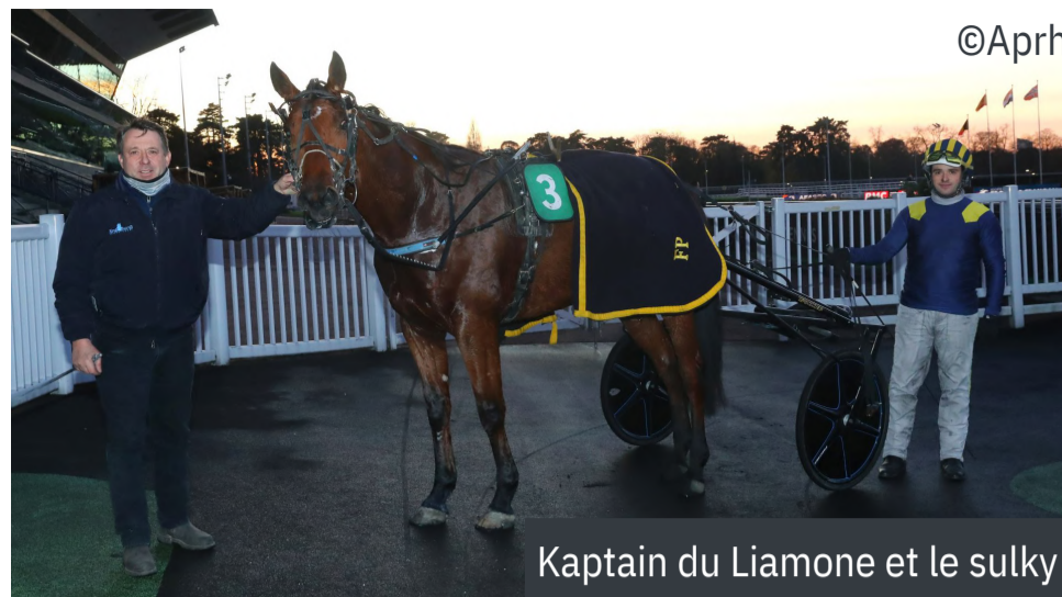
Kaptain du Liamone et le sulky

4 e : Destiny Di Poggio - 5 e : Jim Perrine - 6 e : Heartbeat Thunder - 7 e : Dayak (ity)