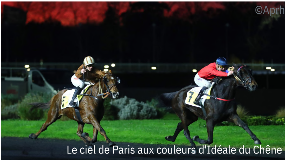
Le ciel de Paris aux couleurs d'Idéale du Chêne