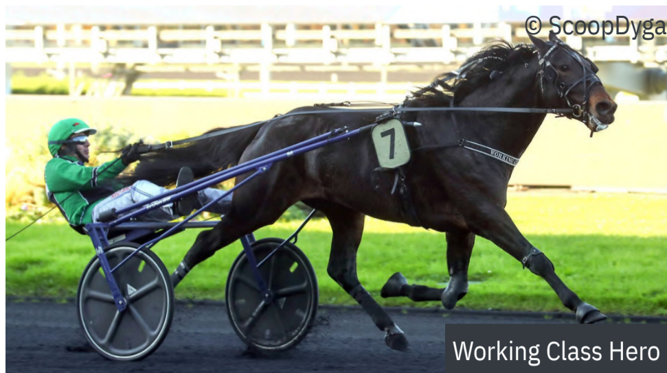
Working Class Hero