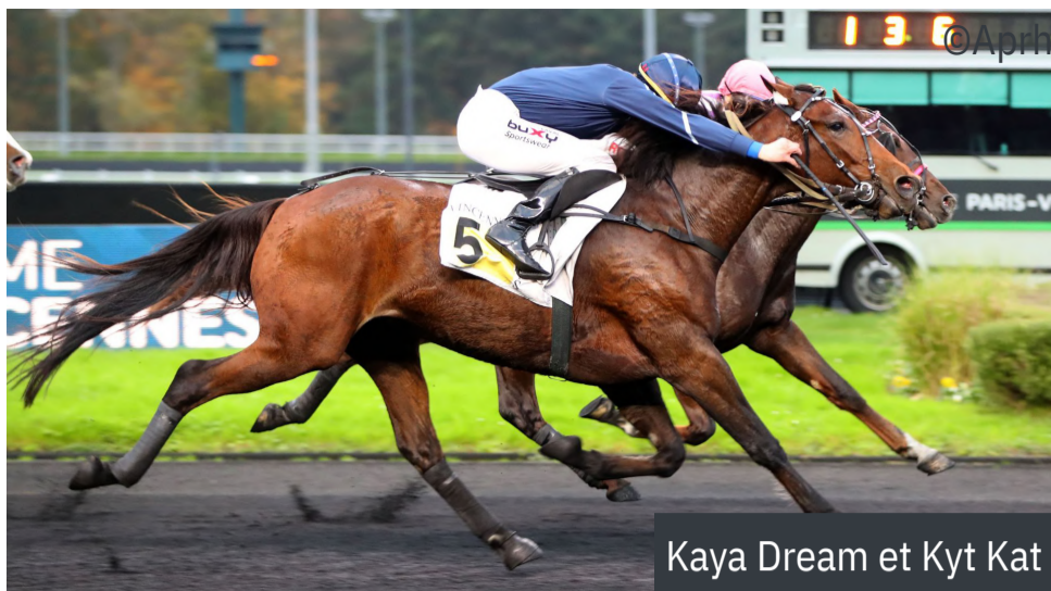
Kaya Dream et Kyt Kat