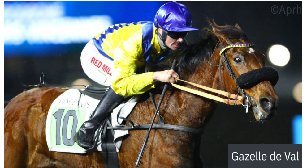
Gazelle de Val

4 e : Jongleuse de Lune - 5 e : Jolie Surprise - 6 e : Just A Midi - 7 e : Hnokki Speed