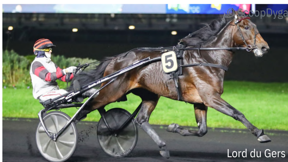
Lord du Gers

Deux poulains de 3 ans estimés vont s'affronter dans le huitième rendez-vous du jour : Lord du Gers (Face Time Bourbon) et Le Sap (Earl Simon). Doté de beaucoup de tenue, chacun d'eux va être allégé dans sa ferrure (plaquage). Ces deux jeunes pousses ont comme point commun d'avoir été battus seulement une fois depuis leur début de carrière. Lord du Gers compte trois victoires en quatre sorties publiques alors que Le Sap a triomphé à quatre reprises en cinq courses.