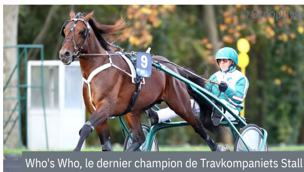
Who's Who, le dernier champion de Travkompaniets Stall