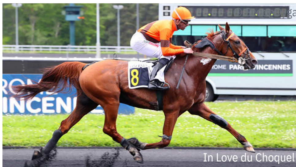
In Love du Choquel