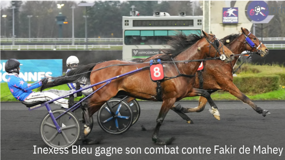
Inexess Bleu gagne son combat contre Fakir de Mahey