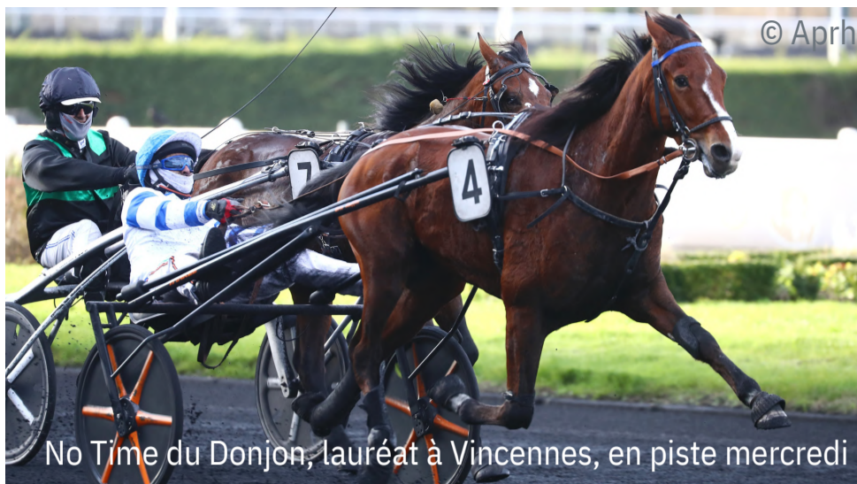
No Time du Donjon, lauréat à Vincennes, en piste mercredi