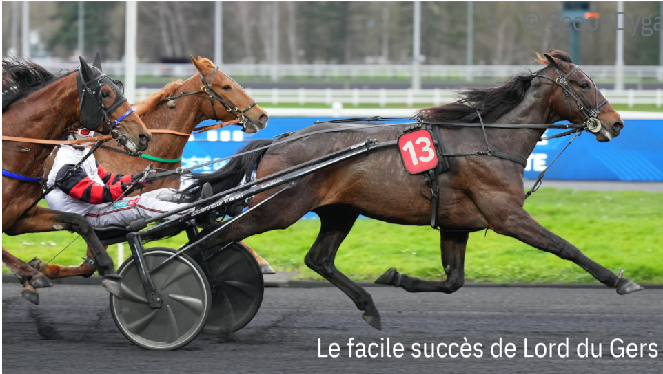
Le facile succès de Lord du Gers