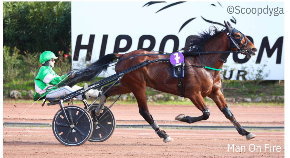
Man On Fire

4 e : Heros des Mottes - 5 e : Iseult Flower - 6 e : Keno Petteviniere - 7 e : Gimy du Pommereux