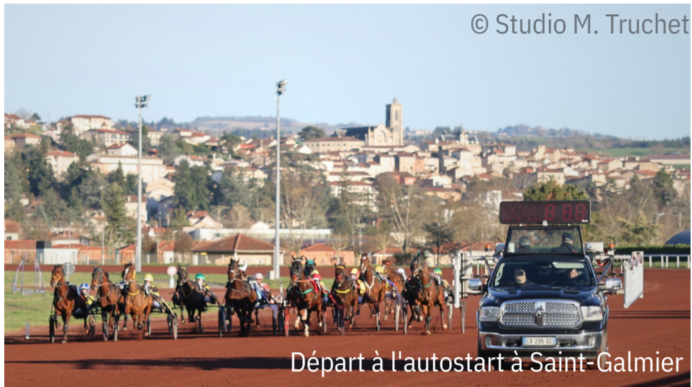
Départ à l'autostart à Saint-Galmier