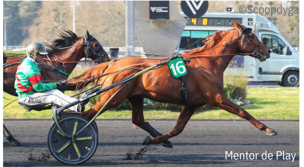
Mentor de Play

4 e : Idylle Express - 5 e : Elegance Kronos - 6 e : Jilord Viva - 7 e : Jazzman (ger)