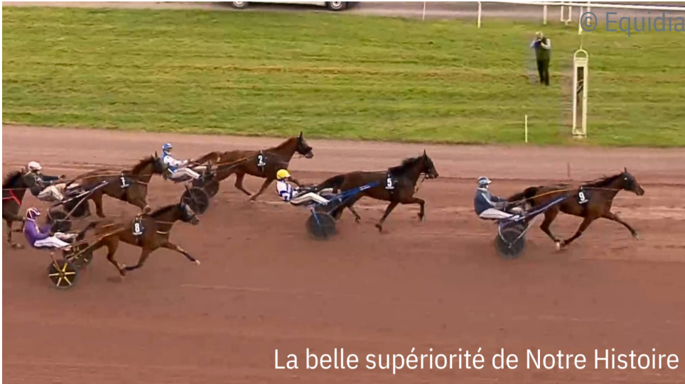
La belle supériorité de Notre Histoire