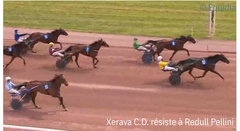
Xerava C.D. résiste à Redull Pellini

4 e : Karma Tejy - 5 e : King Steed - 6 e : Kador des Tithais - 7 e : Kerberos