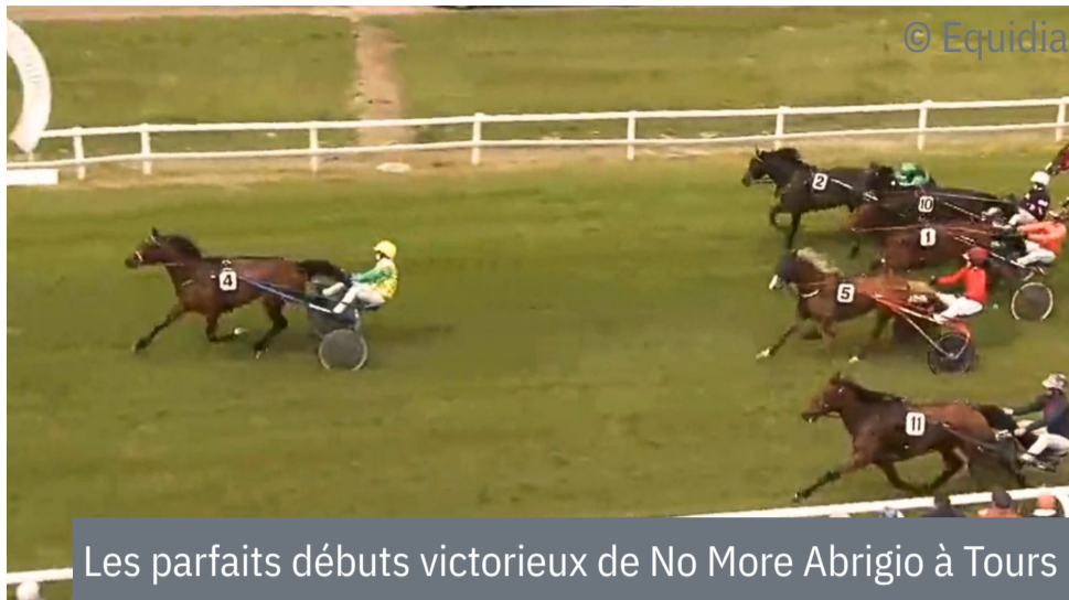
Les parfaits débuts victorieux de No More Abrigio à Tours