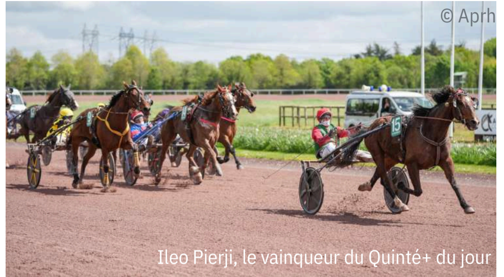
Ileo Pierji, le vainqueur du Quinté+ du jour

4 e : Ni Plus Ni Moins - 5 e : Nino des Ves - 6 e : New Haven Wood - 7 e : Noble du Surf