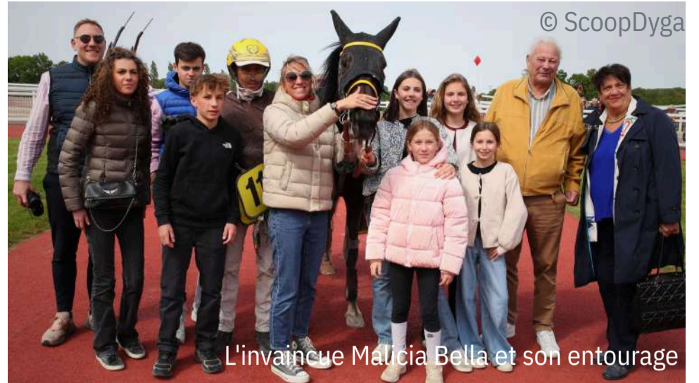
L'invaincue Malicia Bella et son entourage

4 e : Nelly des Charmes - 5 e : Nelson de Chanlecy - 6 e : Nikita Gold - 7 e : Nyx de Val