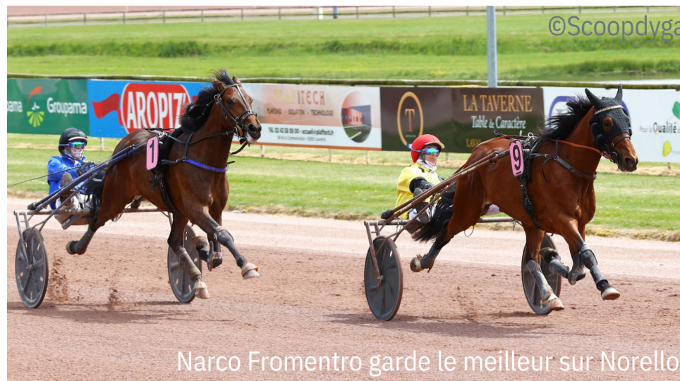
Narco Fromentro garde le meilleur sur Norello