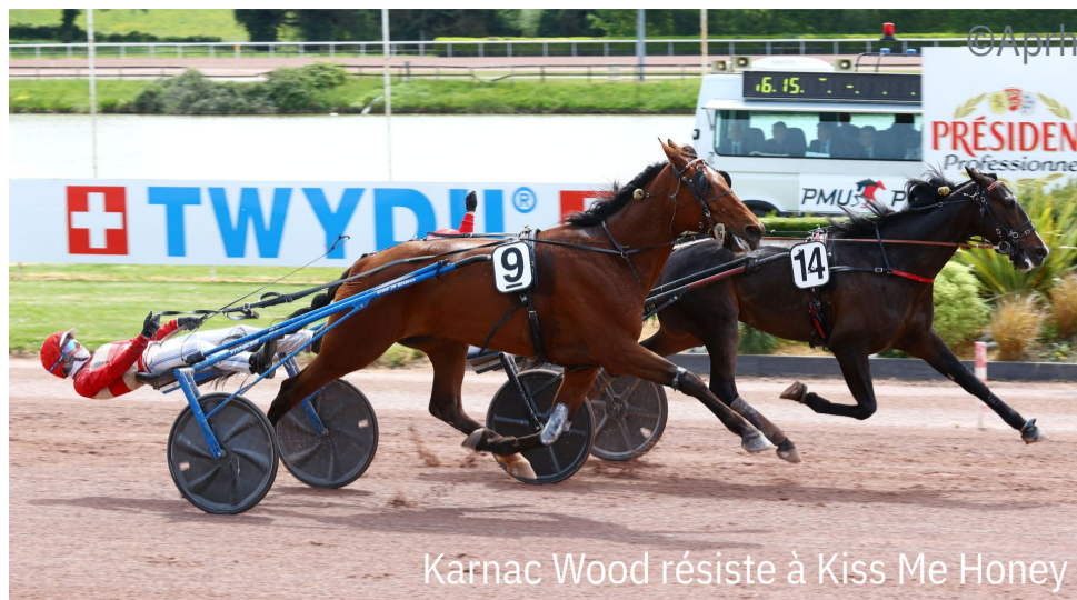
Karnac Wood résiste à Kiss Me Honey