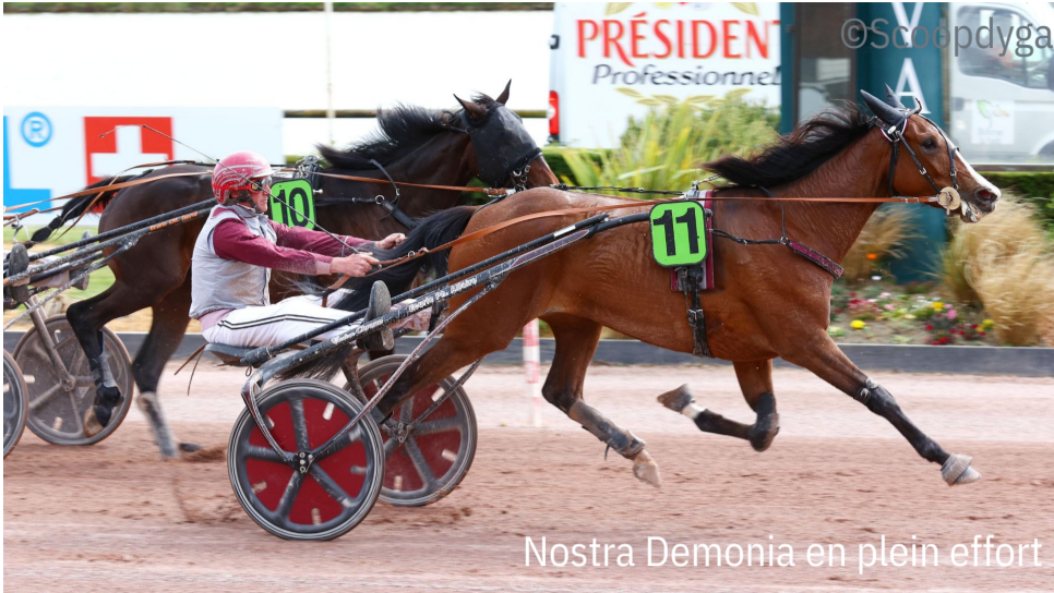
Nostra Demonica en plein effort