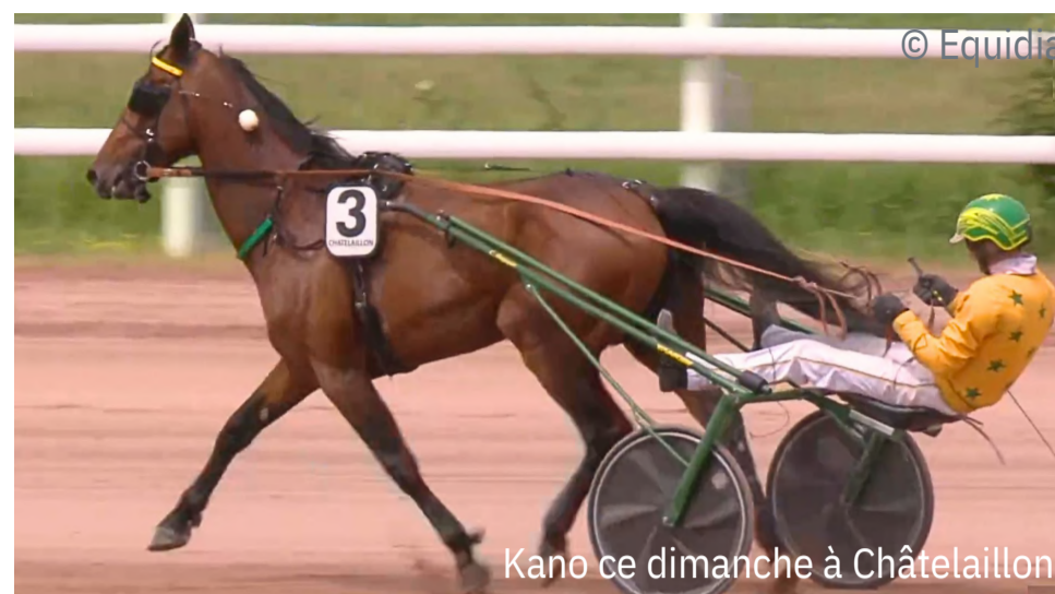
Kano ce dimanche à Châtelailлон