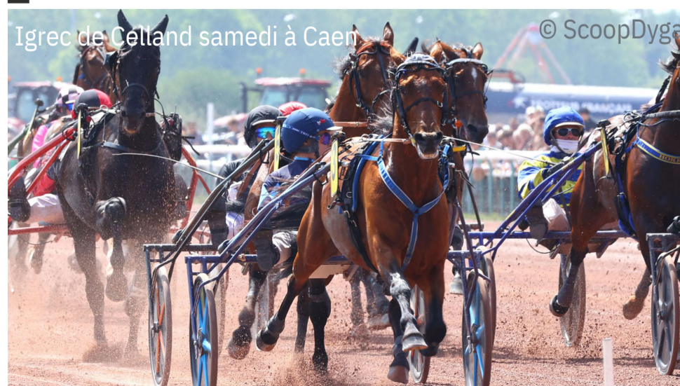
Igrec de Celland samedi à Caen

Note : en passant sous la barre d'1'08 dans les derniers 500m, Idao de Tillard , Inmarosa et Inexess Bleu ont fait fort dans une épreuve disputée à allure sélective (mais normale à ce niveau) sous l'impulsion de Koctel du Dain .