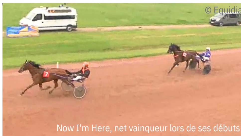
Now I'm Here, net vainqueur lors de ses débuts