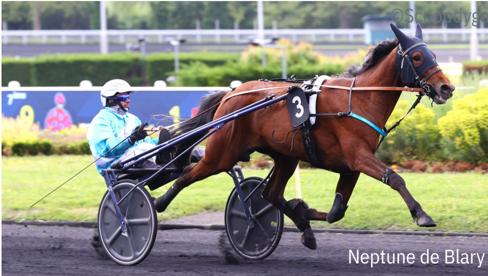
Neptune de Blary