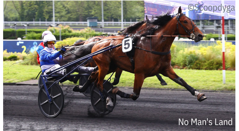
No Man's Land

4 e : Nefertiti - 5 e : Nacara Bella - 6 e : Nuance Kadash - 7 e : N'Attends Personne